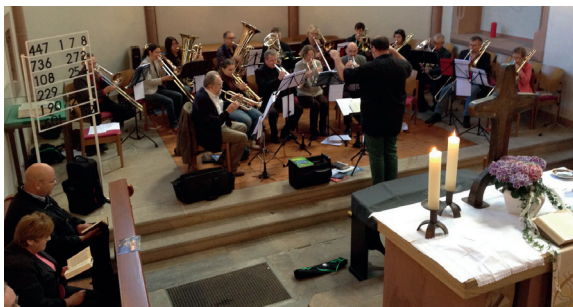
Unser Posaunenchor im Einsatz