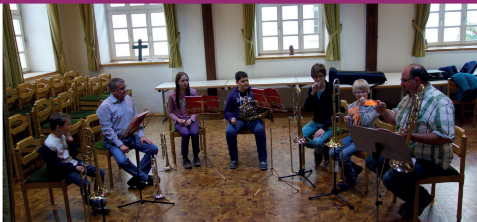
Jungbläser im Posau- nenchor.